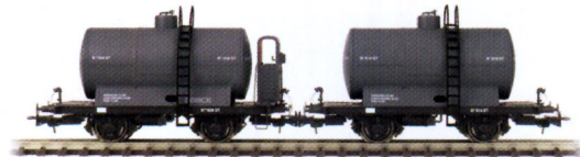
Vagón Cisterna de RENFE Ref. 4502