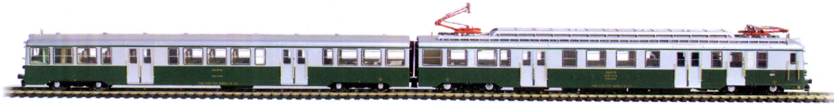
RENFE SERIE 438 (ex UT800) - LIBREA VERDE-PLATA Ref. 4603