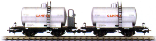
Vagón Cisterna de CAMPSA Ref. 4501